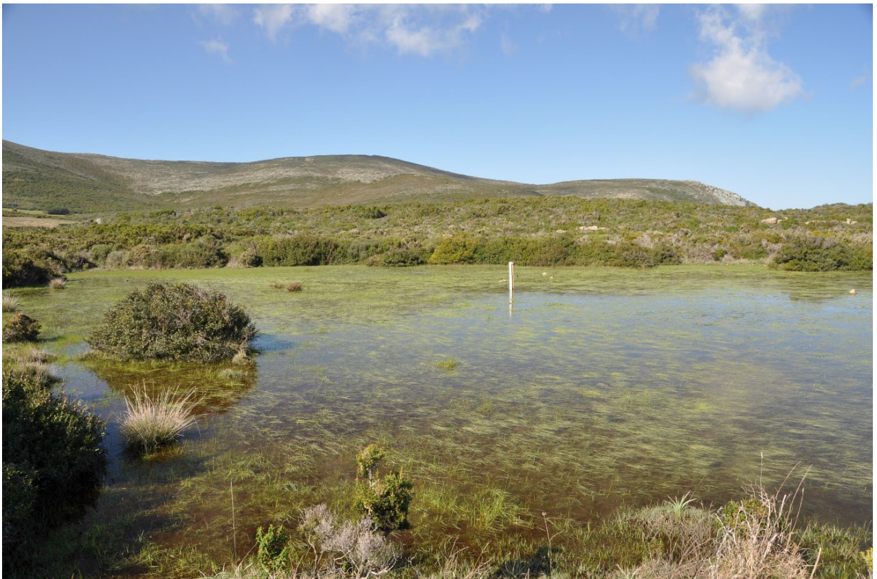
Suivi sur la Mare temporaire de Capandola (Corse)