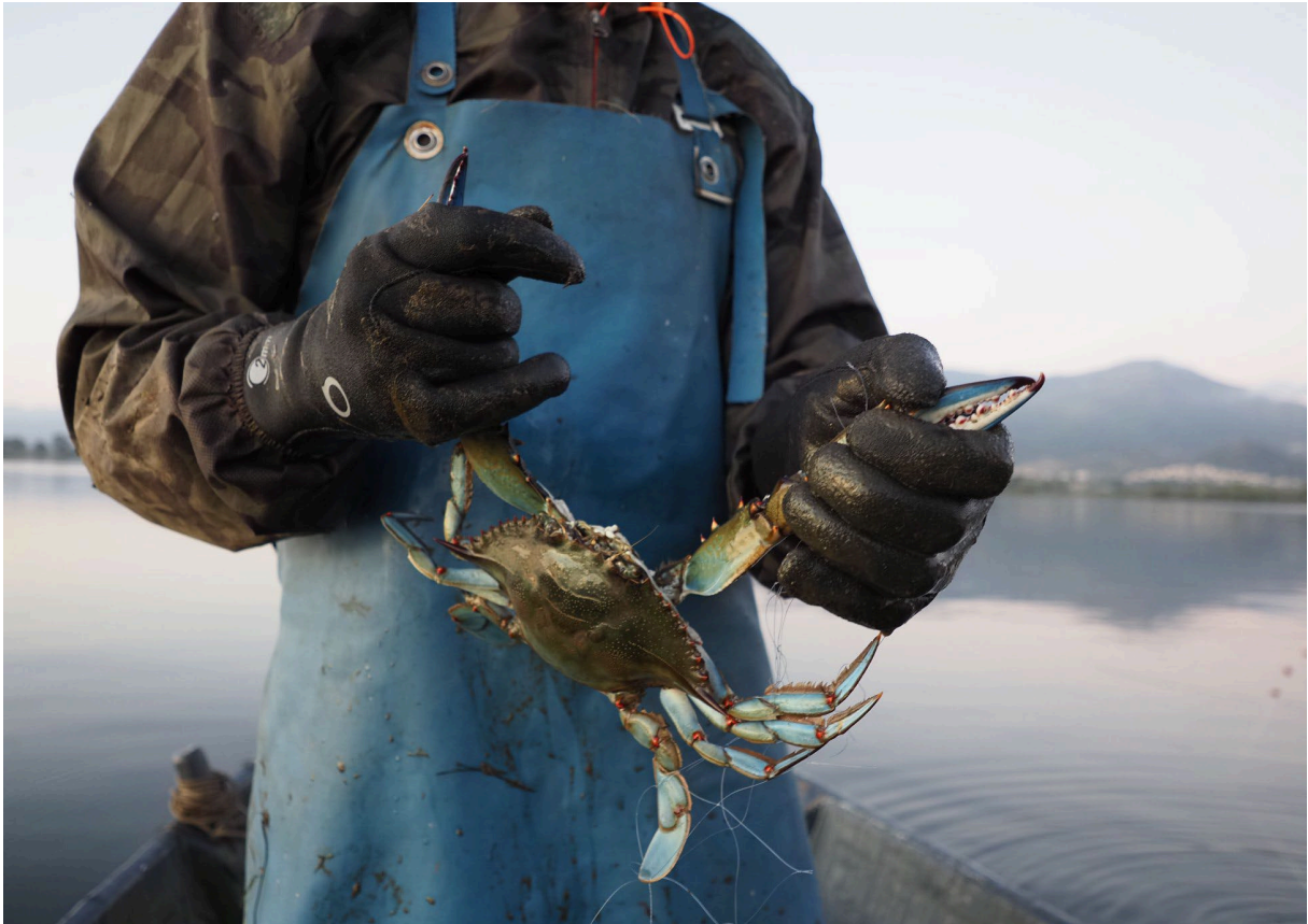
Pêcheur professionnel oeuvrant sur la lagune de Biguglia ayant capturé un crabe bleu ( Callinectes sapidus )