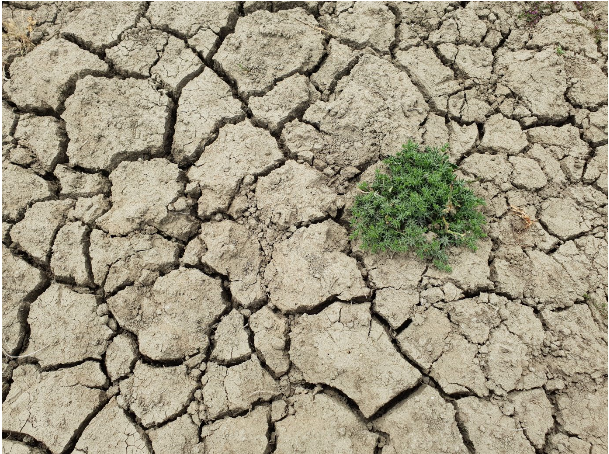
Mare temporaire de Musella (Corse-du-Sud ; Bonifacio) asséchée