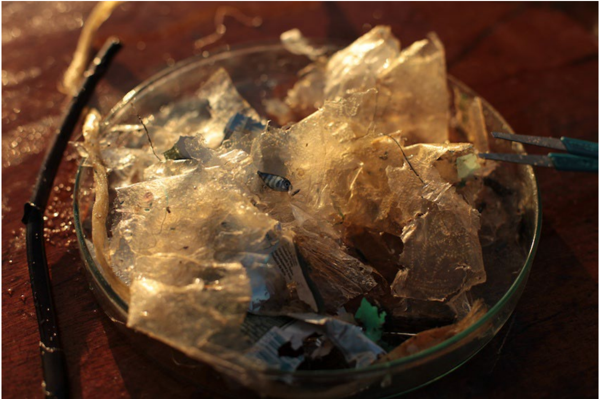
Macro-déchets expédition TaraMed