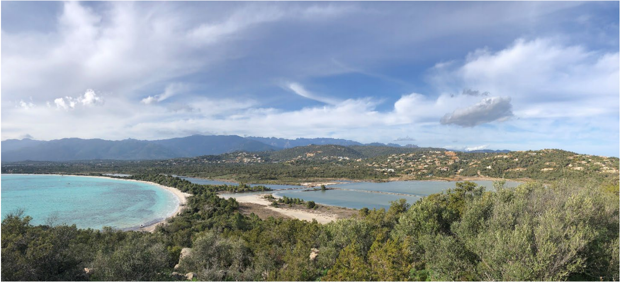
Lagune d'Arasu fortement impactée par un aménagement anthropique (photo en haut © Marie Garrido ; photo en bas © Michel Luccioni)